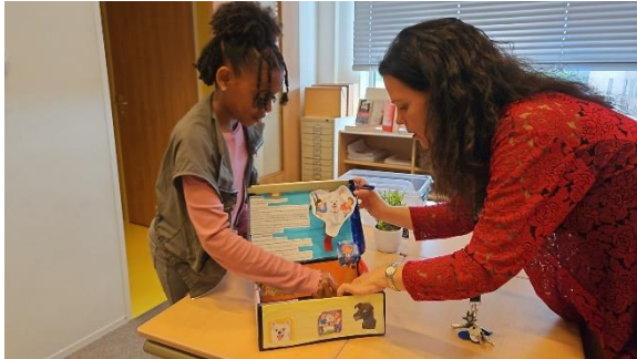
Boekendoos Leespromotie Bovenbouw

De lokalen zijn gewijzigd qua inhoud en bestemming. We hebben nu een Wereld(Engels)lokaal en een aparte Mediatheek-ruimte. De Montessori-materialen staan zichtbaar op de gangen die we als leerpleinen gebruiken.