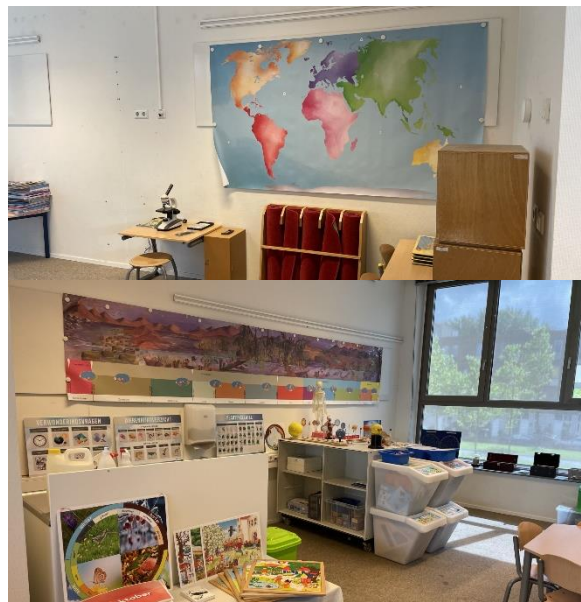
Het kosmische wereld(Engels)lokaal