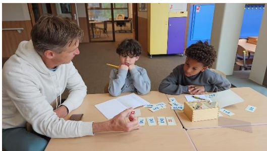
Ondersteuning rekenen op het leerplein middenbouw