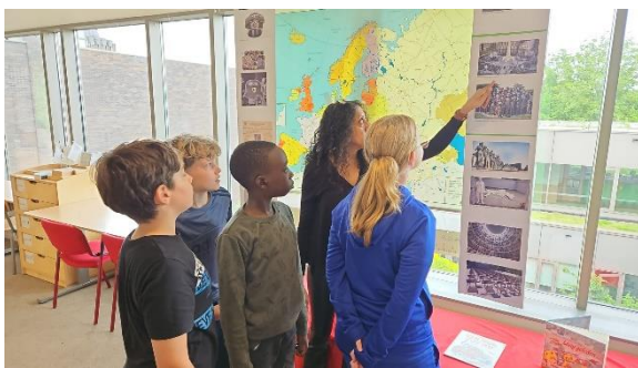
Kosmisch thema Tweede Wereldoorlog Bovenbouw