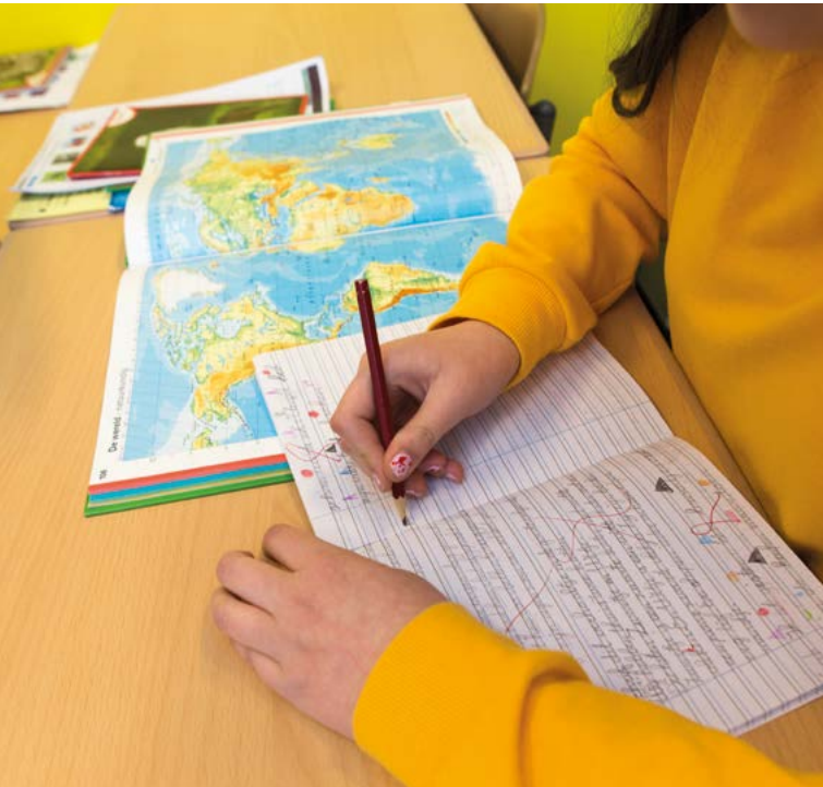
Aan de slag met ingepland werk

Alle vaardigheden die uw kind tot nu toe heeft geleerd, worden in de bovenbouw gebruikt om kennis uit te breiden. Het werk wordt steeds meer door de kinderen zelf vormgegeven en georganiseerd. Hiermee bereiden we uw kind voor op de volgende stap: het voortgezet onderwijs.