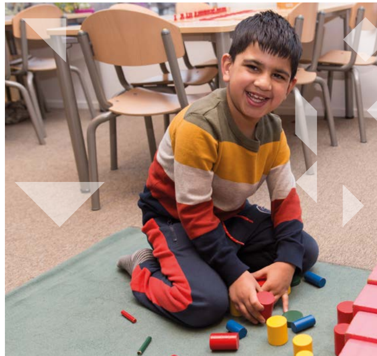
Zelfstandig aan de slag

Voor het monitoren van het sociaal-emotionele functioneren van uw kind gebruiken wij het digitale hulpmiddel ZIEN!. Aan de hand van een vragenlijst kan de leerkracht het sociaal-emotionele functioneren van uw kind in kaart brengen. Hieruit kunnen suggesties komen voor de leerkracht hoe hij een kind extra zou kunnen ondersteunen. Als een kind extra zorg nodig heeft of juist meer uitdaging nodig heeft, wordt u als ouder/verzorger hiervan op de hoogte gesteld.