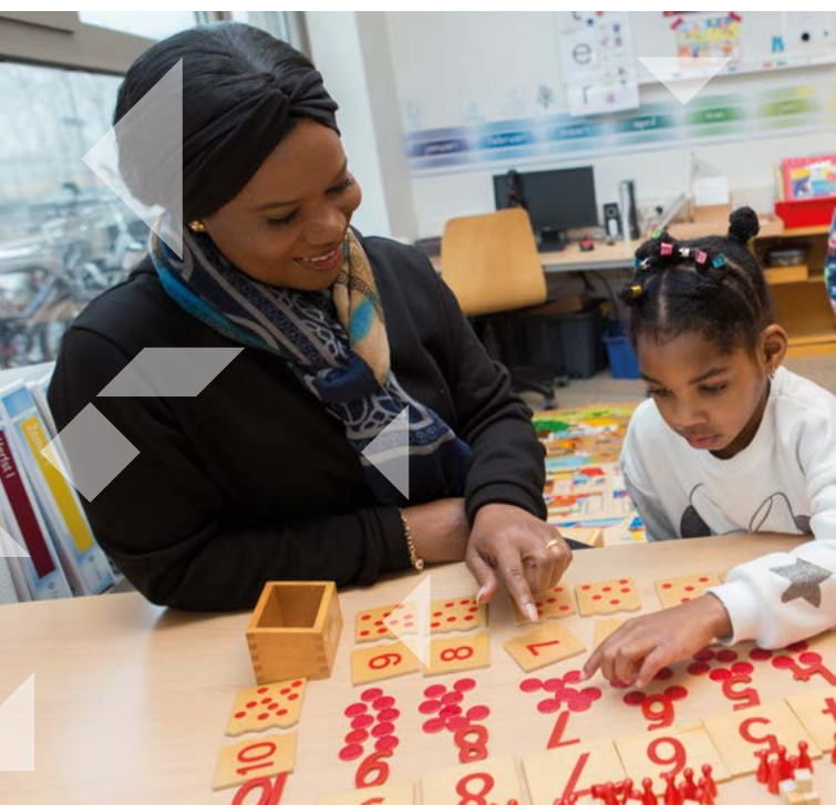
Samen met de juf werken

U kunt bij de schoolmaatschappelijk werker terecht als u vragen heeft over uw kind, bijvoorbeeld over de opvoeding of het gedrag thuis en op school. Indien u vragen heeft kunt u dit bij de leerkracht van uw kind aangeven. Samen met de leerkracht stelt u dan een hulpvraag op. De leerkracht bespreekt dit vervolgens met de intern begeleider. De schoolmaatschappelijk werker zal hierna contact met u opnemen voor een intake. In het geval dat de school zich zorgen maakt over het gedrag van uw kind, zal dit met u besproken worden en kan er overlegd worden of schoolmaatschappelijk werk wordt ingeschakeld.