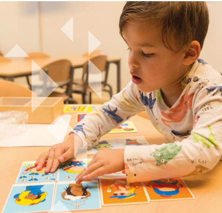
Spelenderwijs aan school wennen

In de onderbouw spelen en leren de kinderen samen. Jonge en oudere kleuters zitten vaak bij elkaar in een groep, zodat ze makkelijk van elkaar leren. De kinderen werken individueel en in kleine groepjes aan tafels, in de hoekjes en op de gang.