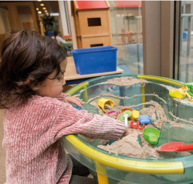
Overblijven op de Clipper

In ons gebouw zit ook kinderopvang Norlandia. Zij bieden voor- en naschoolse opvang aan.